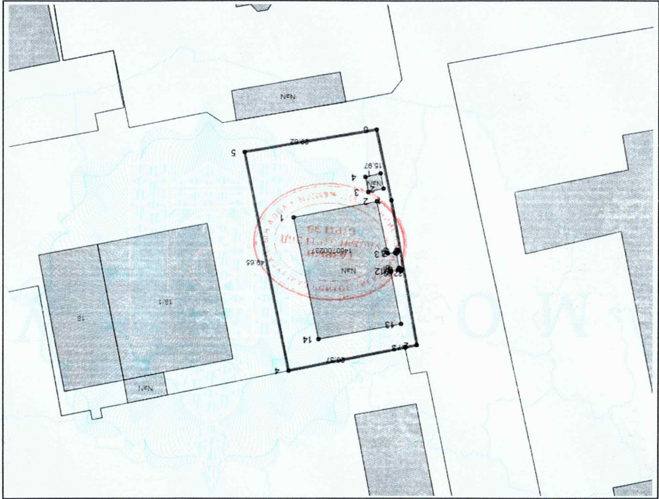
Зургын масштаб = 1:700 (1 сантиметр 7 метр багтана)

Координатын систем: WGS84/UTM 48N EPSG: 32648