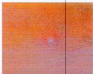
1) Эхэн үеийн цэврүүнцэр тууралт (3 мм хүртэл диаметртэй)