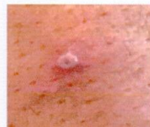
3) Хүйс хэлбэрийн хонхорхойт идээт цэврүүт тууралт (3-4 мм хүртэл диаметртэй)