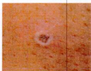
4) Шархлаат тууралт (5 мм хүртэл диаметртэй)