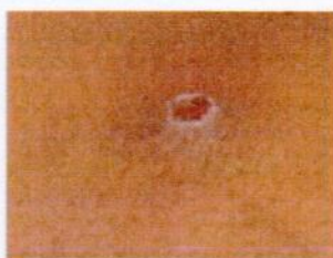
5) Хатаж, тавьсэх.