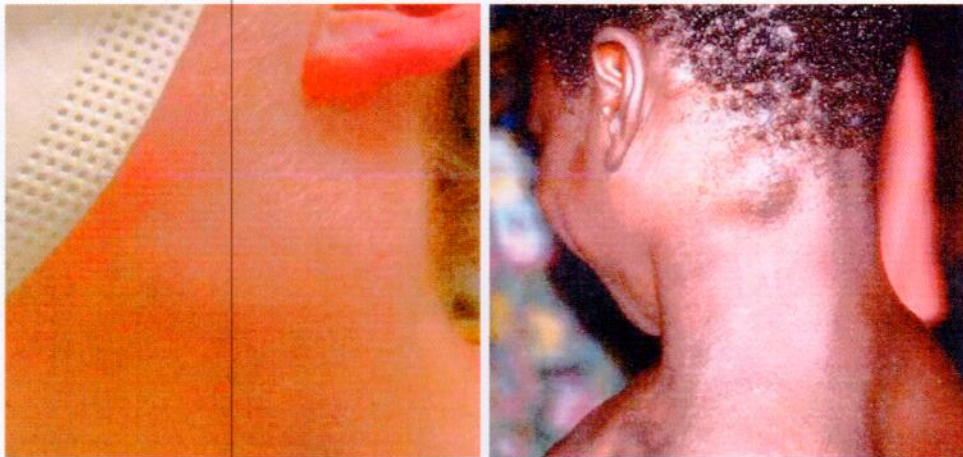
Зураг 1. Тунгалгийн булчирхайн томролт

3.1.2. Ид үе: Өвчний хүндийн зэрэг нь халдвар орсон зам, өвчин үүсгэгчийн төрөл, зүйлээс хамаардаг. (Баруун Африкийн болон Төв Африкийн вирус).