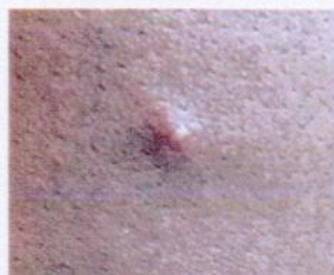
2) Идээт цэврүүнцэр тууралт (2 мм хүртэл диаметртэй)