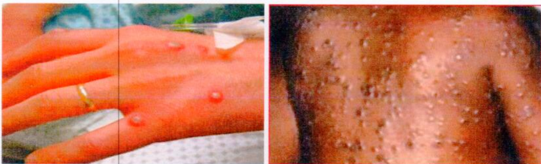
Зураг 2. Тууралт

3.1.2.2. Төв Африкийн сармагчны цэцэг өвчний үүсгэгчээр үүсгэгдсэн тохиолдолд өвчний явц хүнд, нас баралт өндөр байдаг. Эмнэлзүйн гол шинж тэмдэг нь халууралт эхэлснээс 1-3 хоногийн дотор тууралт гарч эхэлдэг. Тууралтын элемент нь толбот, гүвдрүүт, цэврүүт тууралт байх ба тууралтын тоо нь цөөн тоотойгоос хэдэн мянган хүртэл шигүү гарч болно. Ам, хэлэн дээр шарх гарч эхэлнэ. Тууралт нь нүүр, мөчдөөр илүү их гардаг. Нийт тохиолдлын 95% нь нүүрээр, 75% нь хөлийн ул, гарын алгаар, 70%-д амны салст бүрхүүл, 30%-д бэлэг эрхтэн, 20%-д нүдний салст бүрхүүлд тууралт гардаг (Зураг 2).