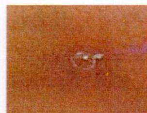
6) Тав ховхрох.